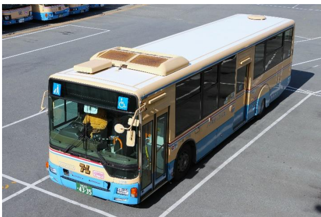
屋根に同素材シートを貼付した車両