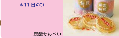
*11日のみ 炭酸せんべい