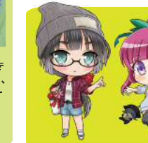
豊能地区 広域観光推進 協議会より お浄るりりん アクリルキーホルダー 各 ¥500