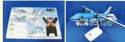
ステッカー ¥200 1/100 モデルプレーン ¥4,800

宝塚ブランド「モノ・コト・パズル」選定商品より 乙女餅、さんしょう昆布、宝塚はちみつ、一点でまる、 花すみれ、金ごまと金ごま加工品、牡丹のお香 など