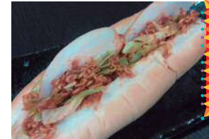
池田名物「池カラ」。 なんと衣がチキン ラーメンなんです。 サクサク・ジューシー、 オトナにも子どもにも 人気のメニューです。