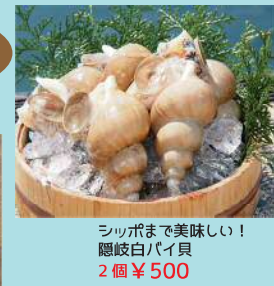
シッパまで美味しい! 隠岐白パイモ 2個 ¥500