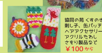
協同の苑 ぐすのき 刺し子、缶バッチ、 ヘアアクセサリー アクリルたわし さそり製品など ¥100 から